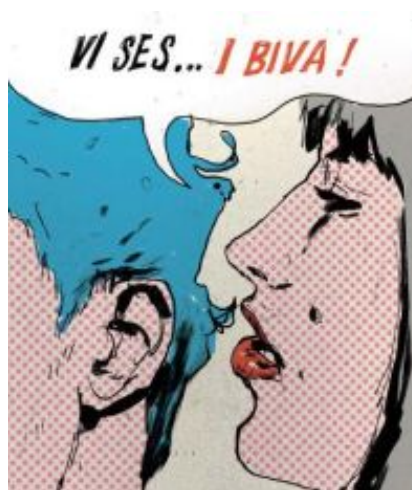
En sladderambassadør i arbejde.